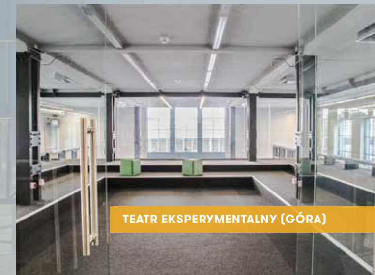
TEATR EKSPERYMENTALNY (GÓRA)

POWIERZCHNIA JEDNEGO RYZALITU ok.124m 2 POJEMNOŚĆ 60 os.