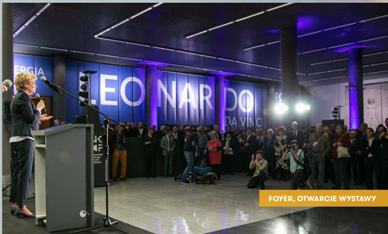
FOYER, OTWARCIE WYSTAWY

Jest to przestronne wnętrze z wylaniającą się z poziomu -2 olbrzymią kopułą Planetarium EC1. Możliwość iluminacji sprawia, że foyer nabiera wyjątkowego charakteru. Jest to przestrzeń idealna na zorganizowanie bankietu, przyjęcia, imprezy firmowej lub innej uroczystości.