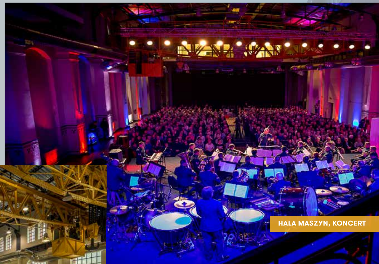
HALA MASZYN, KONCERT

Hala Maszyn EC1 to największa i jednocześnie najbardziej efektywna przestrzeń, którą możemy oddać do Państwa dyspozycji. Jest to zabytkowe pomieszczenie z 1907 r. O jego unikalnym wyglądzie świadczą między innymi oryginalne, historyczne elementy, takie jak suwnica, klatka schodowa wraz z zegarem, bordiury oraz kafle. Hala Maszyn, dzięki wyjątkowemu wnętrzu, stała się ważnym, lubianym i popularnym miejscem, które jest często wykorzystywane na cele organizacji uroczystości okolicznościowych, spotkań firmowych, festiwali oraz innych wydarzeń.