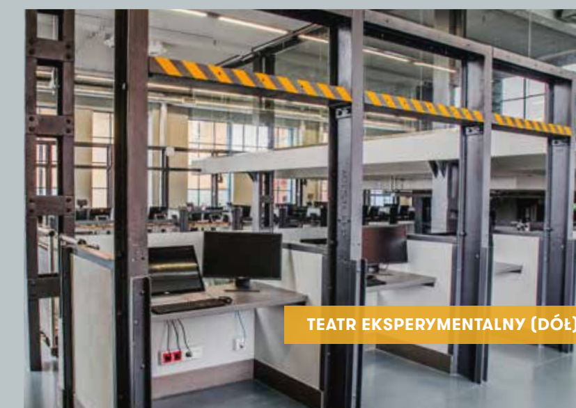
TEATR EKSPERYMENTALNY (DÓŁ)

Kameralne audytorium umożliwia przeprowadzenie warsztatów i szkoleń wymagających bezpośredniej współpracy uczestników. W części zewnętrznej otoczone 18. stanowiskami wyposażonymi w komputery PC z podwójnymi monitorami - w tym po jednym dotykowym - o dużych możliwościach konfiguracyjnych w zakresie hardware'u i software'u.